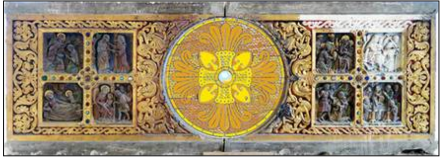
Projet de restauration avec le tabernacle.